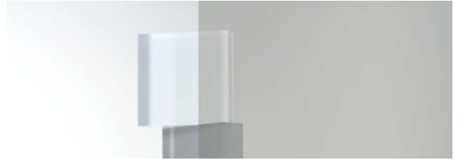
SC-860H サーマZH 1250mm 幅 × 20m 巻