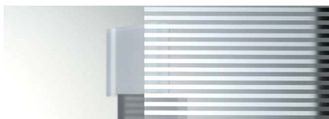
SC-730H CSストライプ 970mm 幅 × 20m 巻