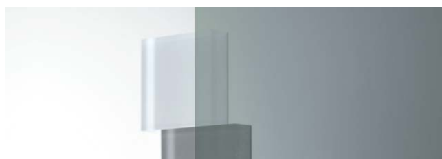
SC-500H 1250mm 幅 × 20m 巻