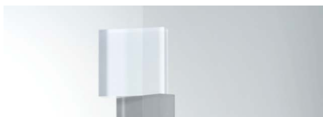
SC-745HT 970mm 幅 × 20m 巻 1220mm 幅 × 20m 巻