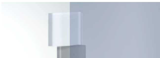
SC-160H ライトブルー 970mm幅×20m巻