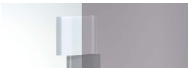
SC-140H グレー 970mm 幅 × 20m 巻