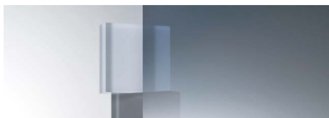
SC-710H CSミラー 970mm 幅 × 20m 巻