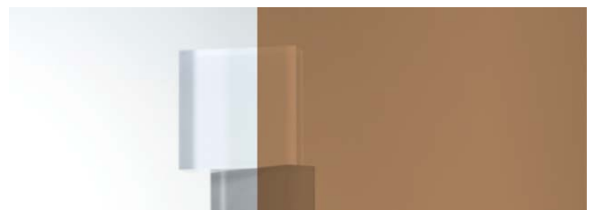
SC-130H ダークブラウン 970mm 幅 × 20m 巻