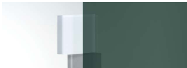
SC-720H Mフィルム 970mm幅×20m巻