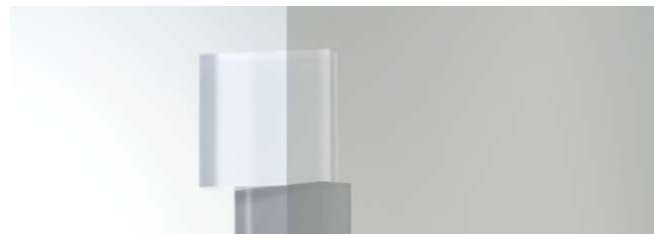
SC-970H 1524mm 幅 × 30m 巻