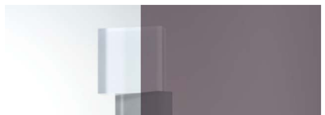
SC-150H スモーク 970mm 幅 × 20m 巻