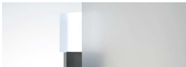
SC-795 1524mm 幅 × 30m 巻