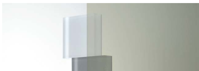
SC-400H 1250mm 幅 × 20m 巻