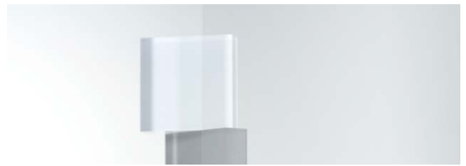
SC-810H サーマ 1250mm 幅 × 20m 巻